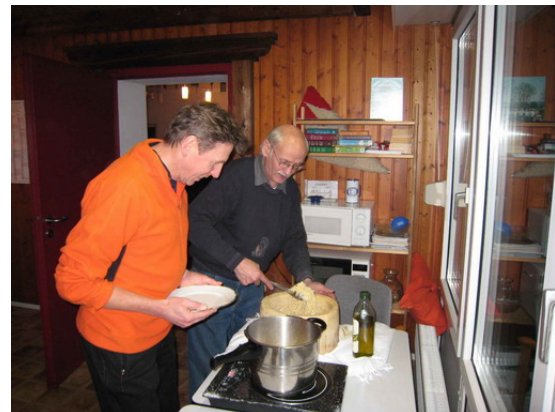
Ein hungriger (Ver)Läufer und der Cheforganisator und Chefkoch