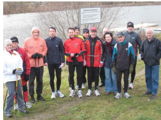
Laufen, Nordic - und Walken und Spaziergehen waren angesagt