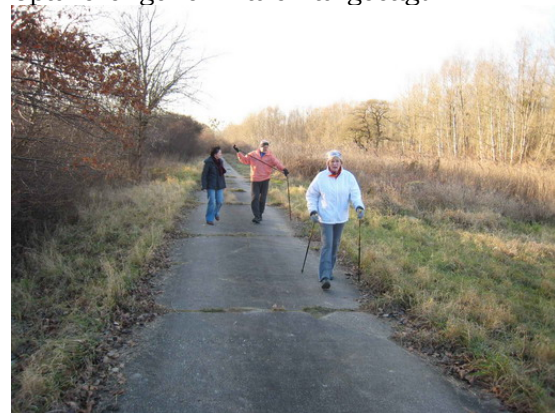
Die Walking-Gruppe, die 3 Schnellen sind nicht mit drauf.