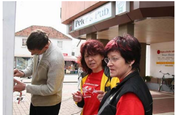
Ob beim Citylauf als Chefin der Verpflegung